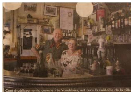
Cent établissements, comme «Le Vaudesir», ont reçu la médaille de la ville.